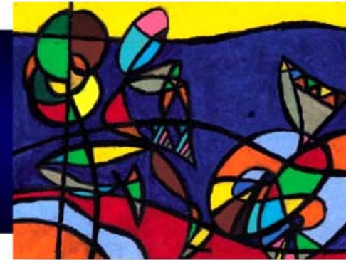
Pastels de Haja RASOLONJATOVO