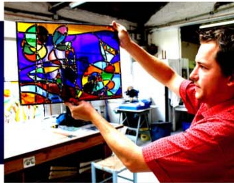
Vitraux de Kevin PICOL